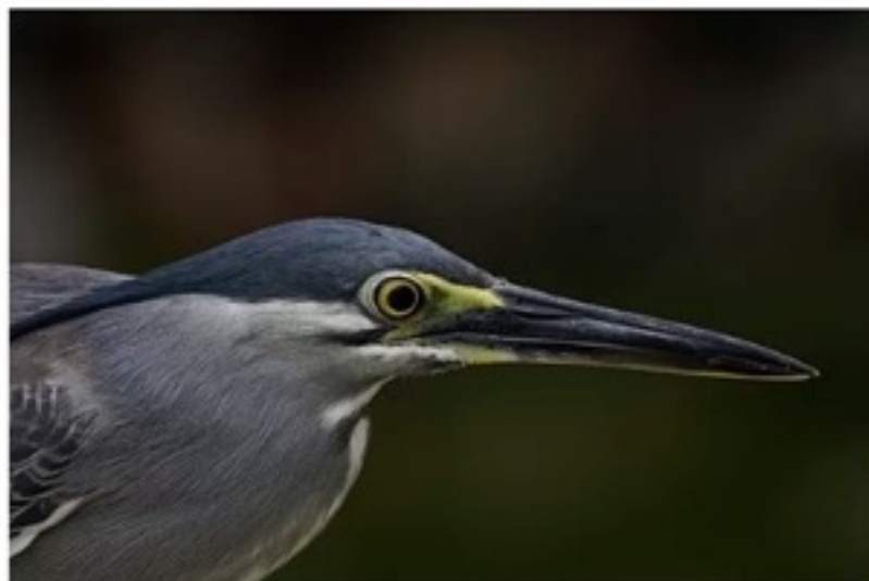
La testa di un aironi striato adulto ( Butorides striata javanica ).

Tweet • RSS Feed • sottoscrivi • Immagini precedenti del giorno