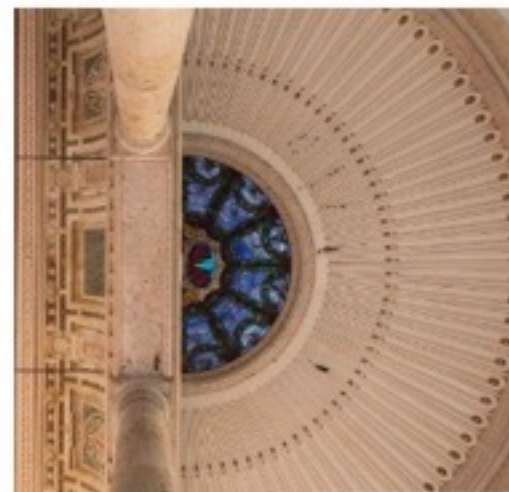
I vincitori del 2018