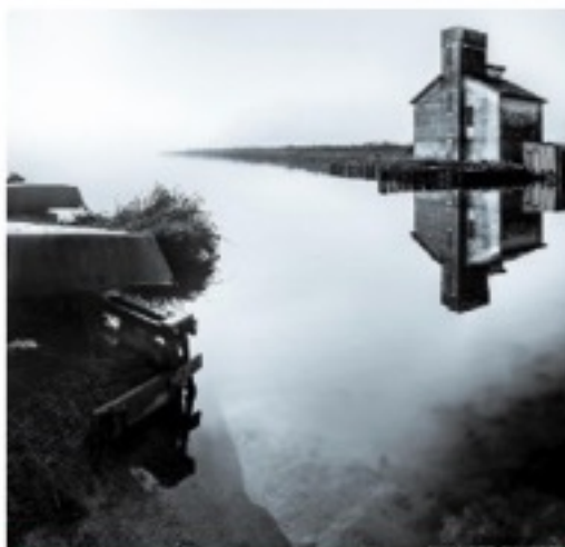
Premi speciali e concorsi locali